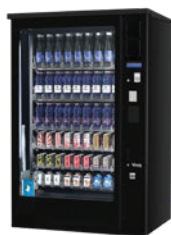
G-DRINK 9 OUTDOOR DM9 OD