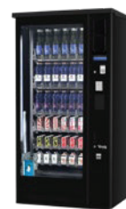
G-DRINK 6 OUTDOOR DM6 OD